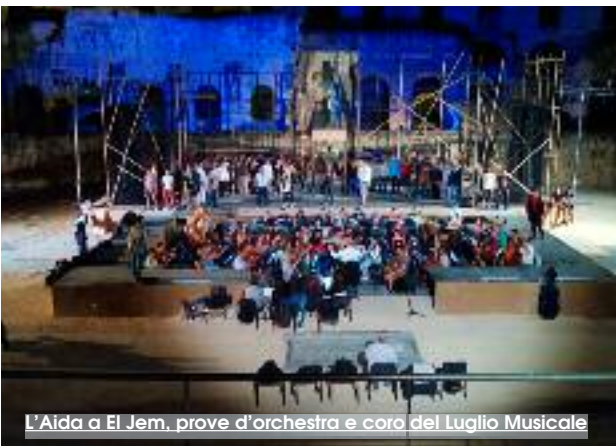
L'Aida a El Jem, prove d'orchestra e coro del Luglio Musicale

Anche questo costituisce il bagaglio culturale della musica e dell'opera, rispettare le credenze religiose altrui, soprattutto di chi ci