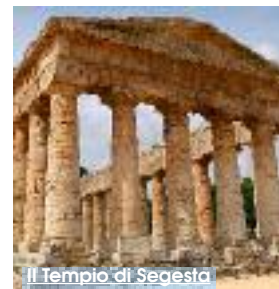
Il Tempio di Segesta

Grazie a "La Sicilia in Cammino", un piano di sviluppo Sostenibile nato dalla collaborazione tra il Club Unesco di Palermo e la Trasversale Sicula, domani saranno numerosi gli eventi dedicati alla promozione dei percorsi di trekking. Infatti, nella città di Calatafimi Segesta e presso il sito greco più conosciuto e meglio conservati al mondo si svolgerà una giornata dedicata al trekking lungo il tratto dell'Antica Trasversale Sicula che va dal bosco di Angimbè al Tempio dorico di Segesta. Sarà un percorso tra storia e natura a cui parteciperanno associazioni no profit, scuole, camminatori, naturalisti, ar-