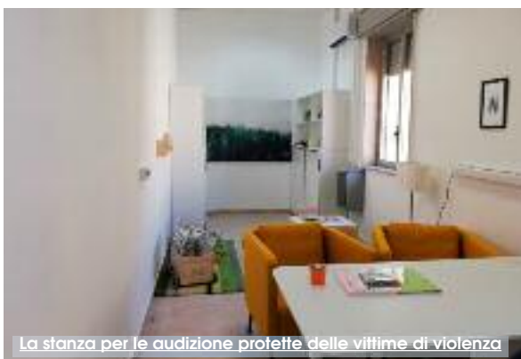
La stanza per le audizione protette delle vittime di violenza