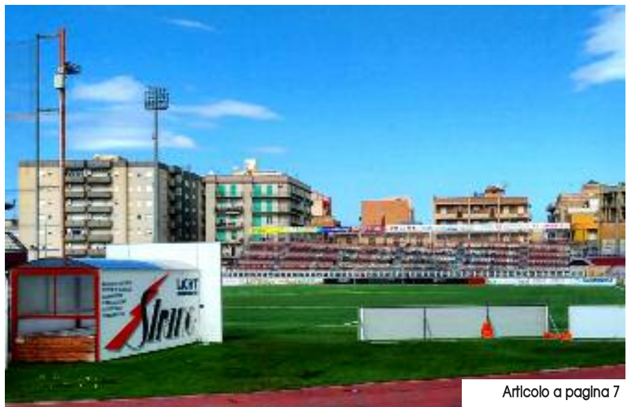
Articolo a pagina 7