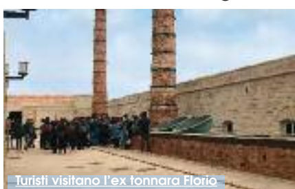
Turisti visitano l'ex tonnara Florio

Da domenica prossima cambiano gli orari di apertura al pubblico all'ex Stabilimento Florio delle Tonnare di Favignana e Formica. L'ingresso, anche per i mesi di agosto e settembre, sarà previsto dalle ore 10 alle 13.30 e dalle ore 17 alle 23. Gli orari delle visite guidate invece saranno: 10.30, 11, 12, 17.15, 18, 19, 20.30 e 21.30. Domenica, come ogni prima domenica del mese, l'ingresso sarà gratuito. Per tutti gli altri giorni il biglietto d'ingresso è di 6 euro, gratuito per i minori. La visita guidata multilingue è gratuita. L'ex Stabilimento Florio è presente su tutti i canali social fra cui Facebook, Twitter, Instagram, Pinterest, YouTube, Google+. Dal 9 luglio al 25 agosto l'antico opificio per la lavorazione e il confezionamento del tonno ospiterà la rassegna letteraria "L'altra marea - Approdi d'autore alla Tonnara Florio di Favignana", curata dal giornalista e scrittore trapanese Giacomo Pilati che dialogherà con alcuni dei protagonisti della scena letteraria italiana. (G.L.)